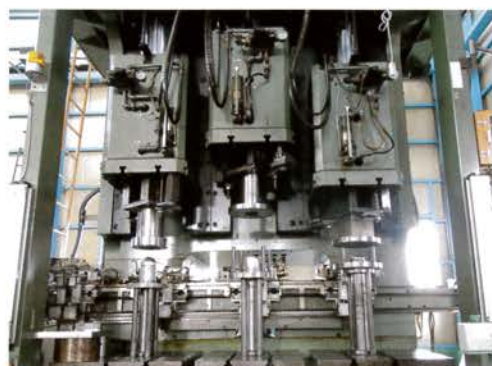
多行程油圧プレス